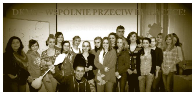
Wolontariusze z PWSZ

Natomiast nasze studentki pokazały, że zdobyta na zajęciach teoria świetnie się w ich wydaniu przekłada na praktykę. Brawo dziewczyny!