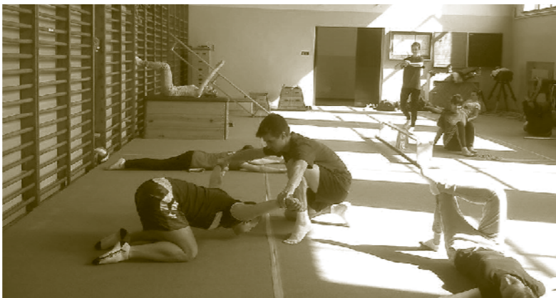
Ćwiczenia korekcyjno-kompensacyjne prowadzone przez studentów PWSZ Racibórz