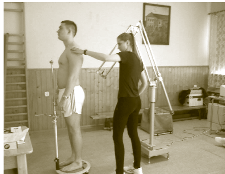
Ocena postawy ciała z wykorzystaniem Posturometru PWSZ Racibórz