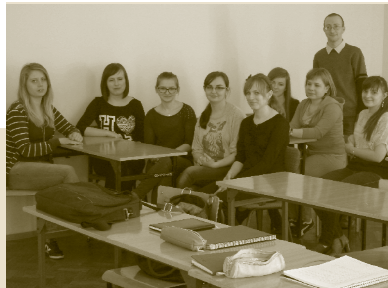
II rok terapii psychopedagogicznej

na to wybór odpowiedniej uczelni, która oprócz ciekawych i przyszłościowych kierunków, powinna umożliwić studentom rozwój ich zainteresowań i pasji. Taka właśnie jest Państwowa Wyższa Szkoła Zawodowa, której zaplecze naukowe oraz przyjazna atmosfera, pozwalają nam-studentom zdobyć zawód marzeń i posmakować iście studenckiego życia. Na uczelni możemy korzystać z bogatej infrastruktury, uczestniczyć w różnych projektach organizowanych w ramach kół naukowych, a w razie trudności zwrócić się o pomoc lub cenną poradę do życzliwych i kompetentnych wykładowców. Z kolei bliskie położenie uczelni, umożliwiające studiowanie „po sąsiedzku” bez konieczności wyjeżdżania z miasta, zdecydowanie jest jej kolejną zaletą.