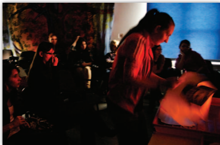
Tajemniczy proces wywoływania obrazu fotograficznego

czyli wywoływanie obrazów fotograficznych