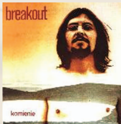
Okładka płyty „Kamienie” z 1974 roku